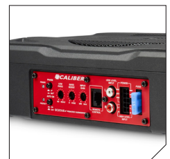
Control panel for optimizing sound