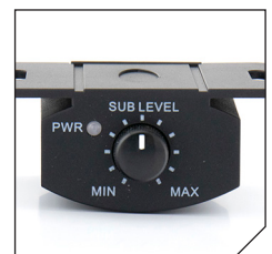
With separate remote control