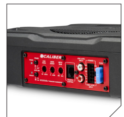
Control panel for optimizing sound