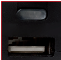
USB Anschluss (ausgang: 5V / 3A)